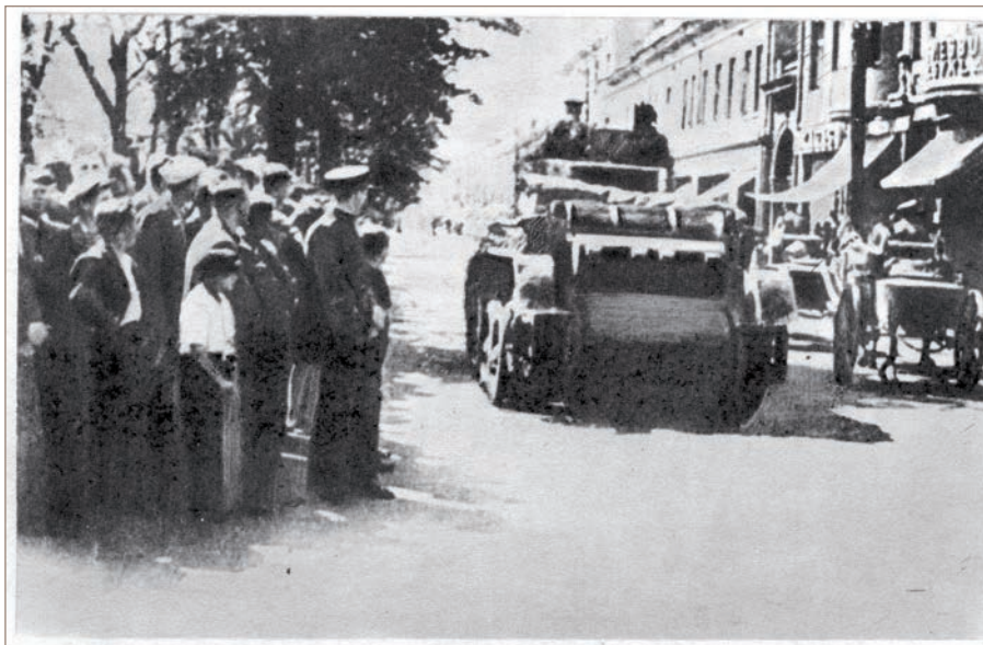
Оккупационная армия вступает в Каунас 15 06 1940 г.

международного права. Россия, захватив Крым, сосредотачивая войска у границы с Украиной, нанесла вред не только Украине, но и системе международных соглашений. Европейский парламент отметил, что «утверждение России о том, что у нее есть право использовать все средства для защиты русскоязычного меньшинства в третьих странах (...) не отвечает положениям международного права и нарушает основополагающие принципы международной жизни в XXI в., а также вызывает опасность порядку послевоенной Европы». По мнению профессора по экономике Колумбийского университета Джеффри Сакс (Jeffrey D. Sachs), если Россия не изменит свою политику, нас ожидают особо серьезные мировые последствия, международные отношения будут еще более напряженными и проникнуты духом национализма. Ошибка с той или другой стороны может привести к трагической войне. В столетней истории до начала Первой мировой войны мы всегда можем найти доказательства того, что единственный способ обеспечения безопасности – международное право, которое поддерживает ООН и уважают все страны.