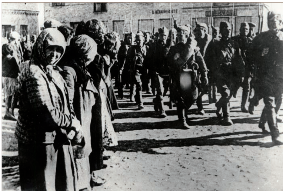
Части Красной армии в Эйшишкес 15 06 1940 г.