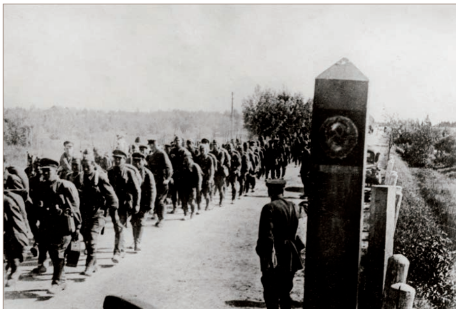
Солдаты Красной армии переходят границу СССР-Литвы. 15 06 1940 г.