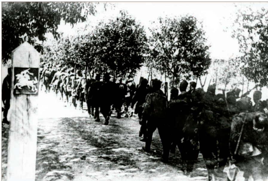
Солдаты Красной армии переходят границу СССР-Литвы. 15 06 1940 г.

Направления тогдашней экспансионистской политики Кремля четко проявляются в директиве Политического управления Красной Армии № 5258сс: «Наша задача ясна. Мы хотим обеспечить безопасность СССР, закрыть с моря на крепкий замок подступы к Ленинграду, нашим северо-западным границам. Через головы правящей в Эстонии, Латвии и Литве антинародной клики мы выполним наши исторические задачи и заодно поможем трудовому народу этих стран освободиться от эксплуататорской шайки капиталистов и помещиков». (...)Литва, Эстония и Латвия станут советским форпостом на наших морских и сухопутных