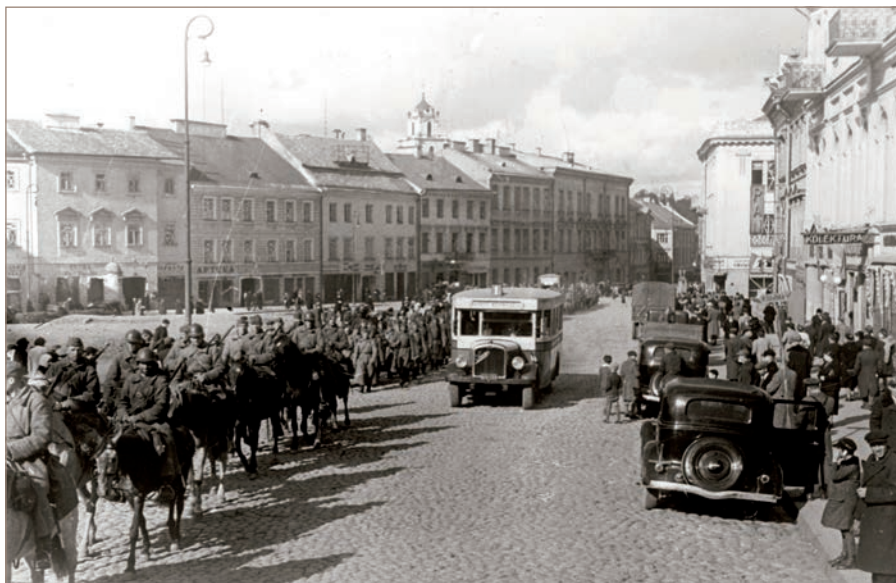
Колонна солдат Красной армии в Вильнюсе. Сентябрь 1939 г.

существующая система власти. Если Латвия откажется от заключения пакта на таких же условиях, как и Эстония, то Советская Армия «в самый краткий срок расправится с Латвией». Оценивая позицию Балтийских стран, Сталин сказал, что «с их стороны в настоящее время не предвидятся никакие эскапады, потому что все они изрядно напуганы». В конце сентября 1939 г. у границ Балтийских стран Советский Союз сосредоточил 437 235 военнослужащих, 3 052 танков и 3 635 артиллерийских орудий.