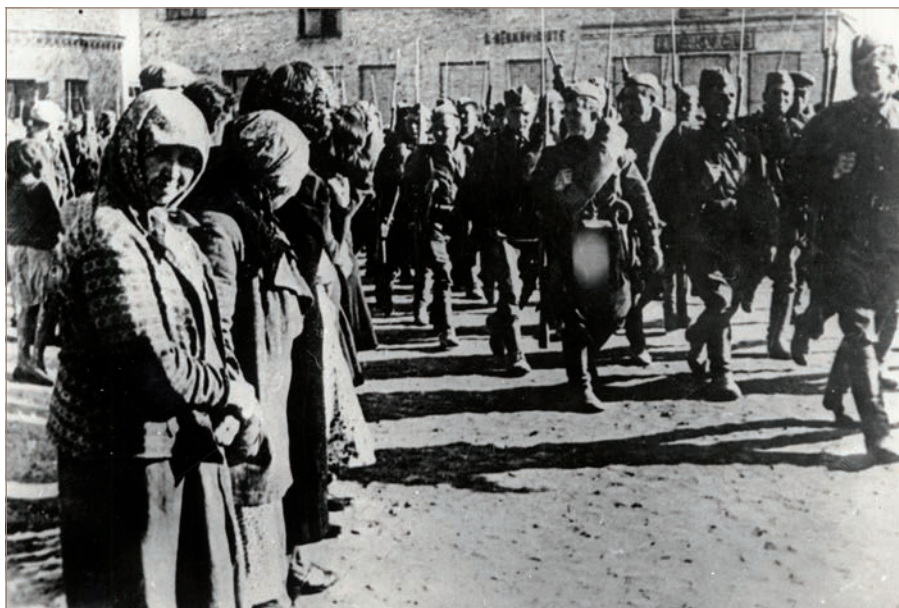
Les troupes de l'Armée rouge traversent la ville Eišiškės, le 15 juin 1940