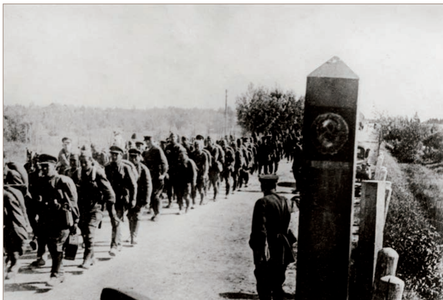
Les soldats de l'Armée rouge traversent la frontière Lituanie-URSS. Le 15 juin 1940