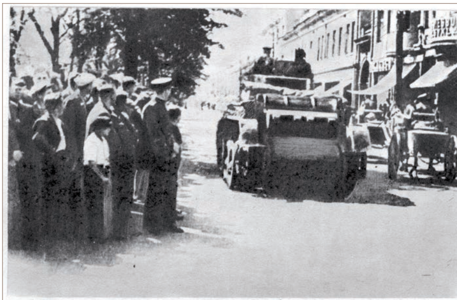
L'armée d'occupation entre à Kaunas, le 15 juin 1940

grave et dangereuse du droit international. En annexant la Crimée et mobilisant son armée aux frontières ukrainiennes, la Russie a porté atteinte non seulement à l'Ukraine mais aussi au système d'accords internationaux. Le Parlement européen a noté que « l'affirmation de la Russie selon laquelle elle a le droit de protéger par tous les moyens les minorités russes établies dans les pays tiers (...) ne se fonde sur aucune disposition du droit international, contrevient aux principes fondamentaux de la conduite des affaires internationales au 21e siècle et menace l'ordre européen d'après-guerre. » Selon Jeffrey D. Sachs, professeur d'économie à l'Université de Columbia, si la Russie ne change pas le cours de sa politique, on devrait s'attendre à de graves conséquences mondiales, les relations internationales deviendraient plus tendues et marquées par le nationalisme. Une erreur d'une partie ou d'une autre peut conduire à une guerre tragique. Les événements du siècle dernier qui ont eu lieu avant la Première Guerre mondiale, prouvent que la seule façon d'assurer la sécurité dans le monde est le droit international qui est soutenu par les Nations Unies et respecté par tous les pays.