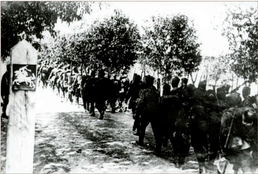
Les soldats de l'Armée rouge traversent la frontière Lituanie-URSS. Le 15 juin 1940

Les orientations de la politique expansionniste du Kremlin sont clairement définies dans la directive N° 5258ss de la Direction politique de l'Armée rouge : « Notre mission est claire. Nous voulons assurer la sécurité de l'URSS, verrouiller tous les accès à la mer près de Leningrad et sécuriser nos frontières Nord-Est. Nous réaliserons nos objectifs historiques malgré l'opposition des chefs des cliques anti-populaires estoniens, lettons et lituaniens, et nous aiderons la classe ouvrière de ces pays à se libérer. (...) La Lituanie, l'Estonie et la Lettonie seront des avant-postes soviétiques sur nos frontières maritimes et terrestres. L'attaque doit se préparer dans le plus grand secret. (...) Nous devons rapidement désintégrer l'armée de l'ennemi, démoraliser ses forces arrière et ainsi aider la direction de l'Armée rouge à remporter la victoire dans les plus brefs délais et avec des pertes minimales. »